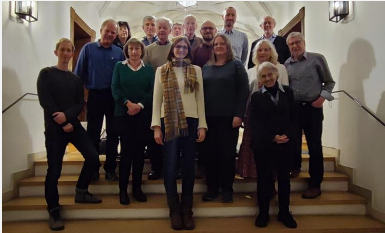
Hitzeaktionsbündnis - vom Reden ins Handeln kommen

April 2024: Gründung Klimabündnis Ebersberg