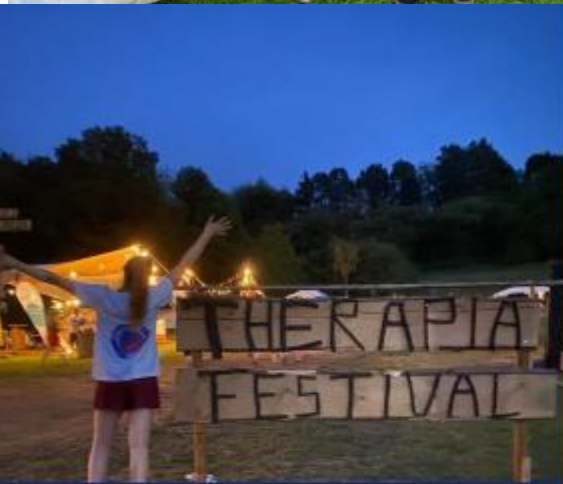
Therapia Festival AG ErgoLogoPhysio